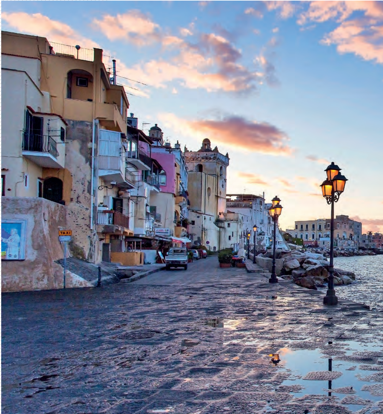
Ischia ist eine Thermalinsel der Antike. Im 17. Jahrhundert entdeckte man heilende Quellen wieder, die bereits die alten Griechen genutzt hatten.