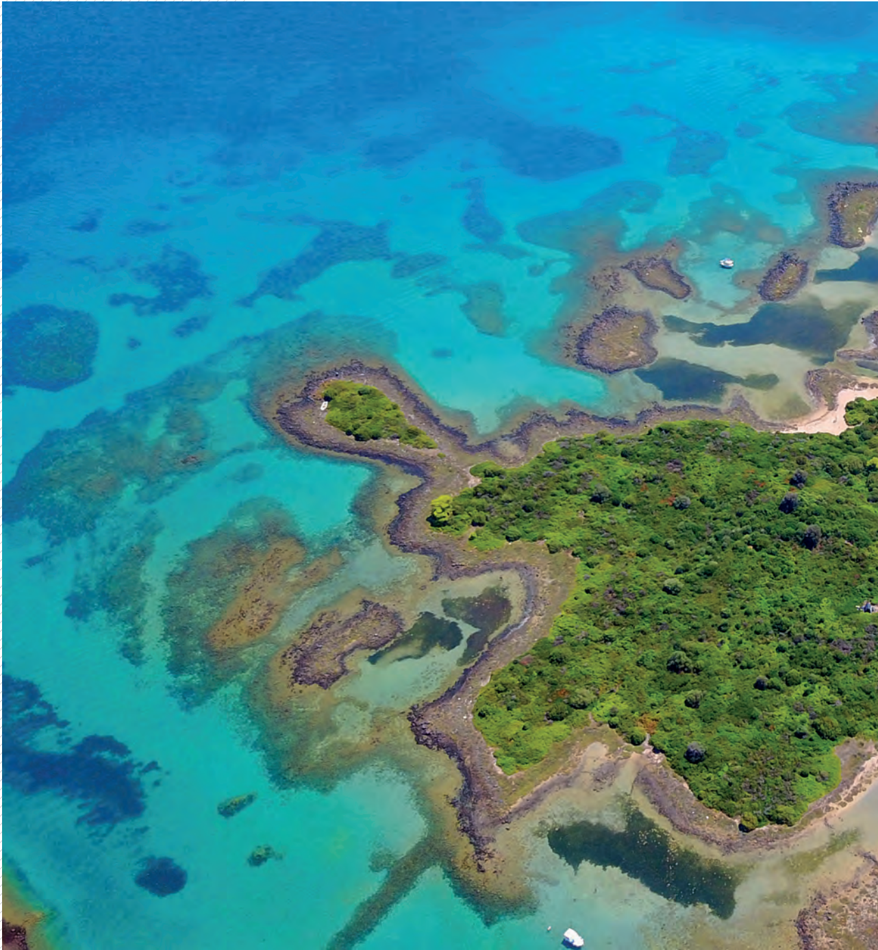
Karibisch mutet die Farbenpracht von türkisfarbenem Wasser und Inselgrün des Lichadonisia-Archipels an, der sich nördlich von Euböa erstreckt.