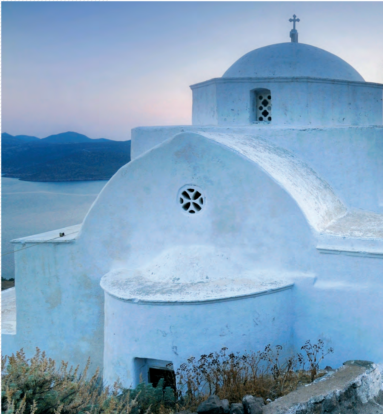
Die weiße Kuppelkirche Panagia Thalassitra steht an der Steilküste von Milos, der westlichsten Insel der größeren Kykladen in der Südlichen Ägäis.