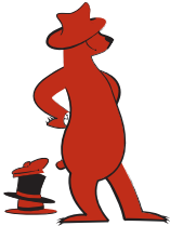
Bruno Bär, der weise und gelassene Lehrmeister