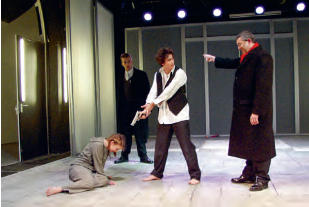
Abb. 8: Inszenierung an der Studiobühne Bayreuth.

menstoß zwischen Ferdinand und seinem Vater im Haus der Familie Miller. Der Degen wird dabei häufig als nicht mehr zeitgemäß empfunden und in heutigen Inszenierungen durch eine Schusswaffe ersetzt. Die Szene ist sehr emotional und wirkungsvoll angelegt und steigert die Spannung dramaturgisch geschickt bis zu einem Handlungshöhepunkt, an dem die verlorene Welt des Hofes erst einmal klein begeben muss.